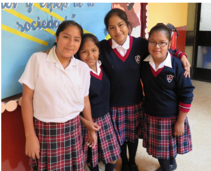
(Elevene på bildet har ikke noe med teksten å gjøre)

Neste år blir jeg ferdig med videregående, jeg skal slutte på Cristiana og skal begynne å realisere drømmen min om å bli journalist, og på den måten gjøre at min mor og lærerne mine blir stolte av den jeg er. Slik vil jeg kunne si takk til alle sammen, takk Cristiana, takk til alle som støtter Svalene, takk lærer, takk Norge, takk mor, for å ha gjort meg til en person som kan bidra.