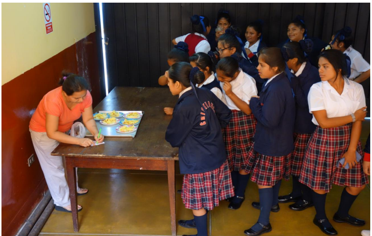
Elever stiller i kø for å få lunsj.