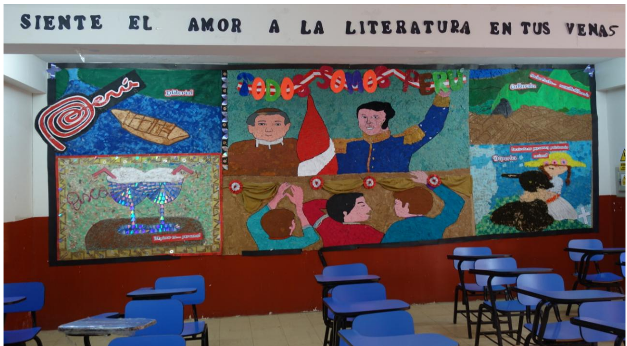
Elever har laget en veggstavle i et klasserom. I midten er det frihetshelter som hylles, rundt noen av Perus karakteristiske særtrekk.