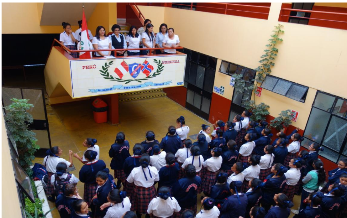
Lærere og elever møtes til nytt skoleår.