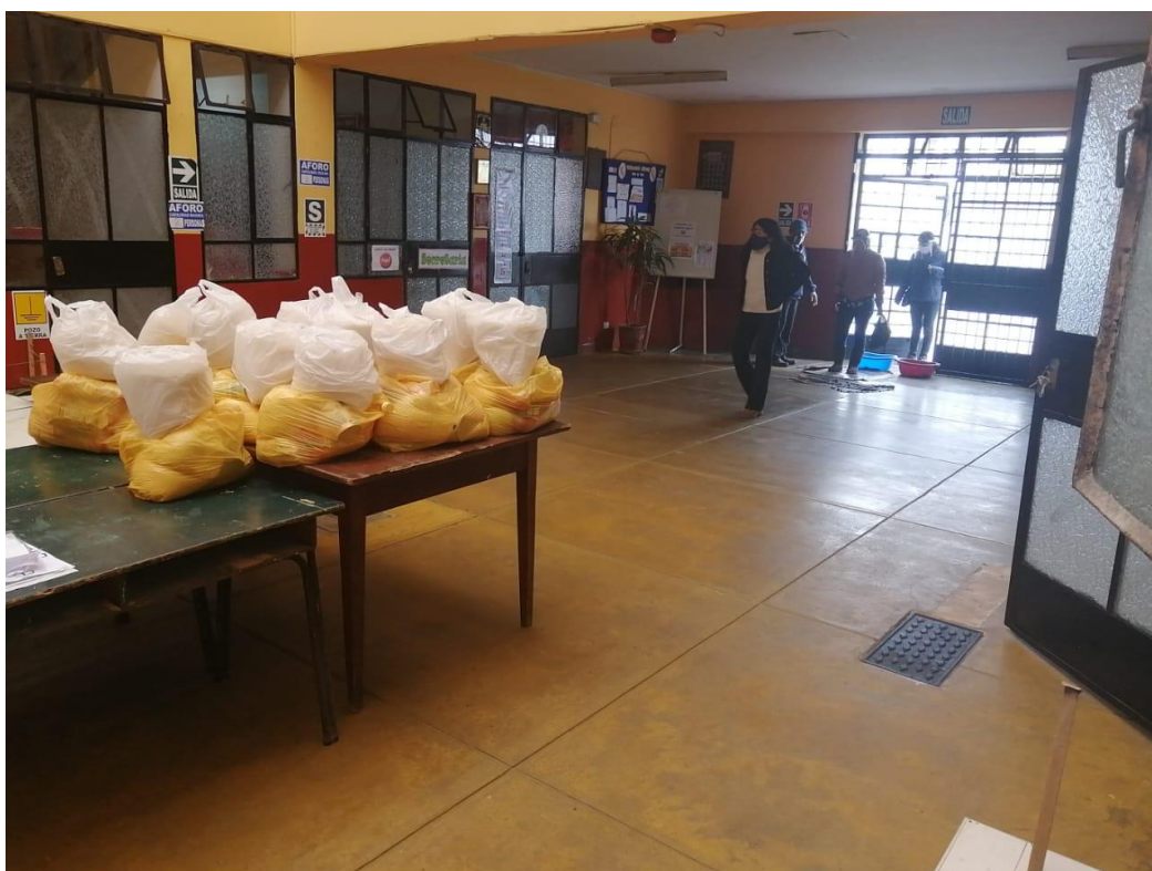
Også denne gangen har vi noen bilder fra matutdelingene ved Cristiania.