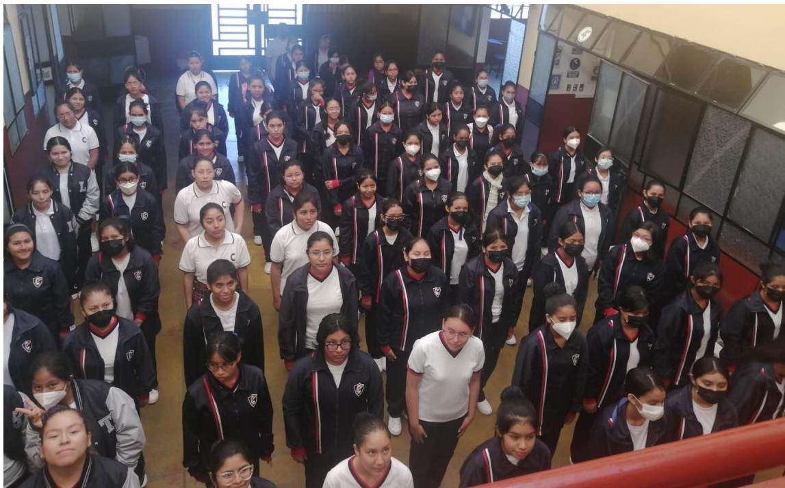
Fra åpningen av skoleåret, 02.03.2023