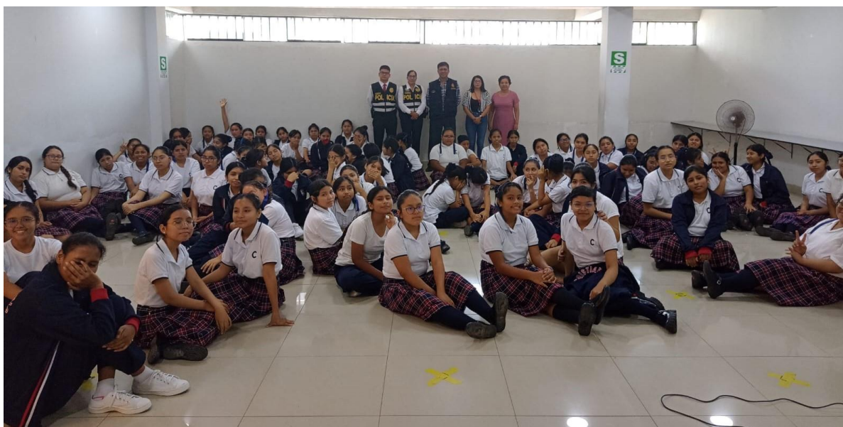
Foredrag for elevene på kvinnedagen