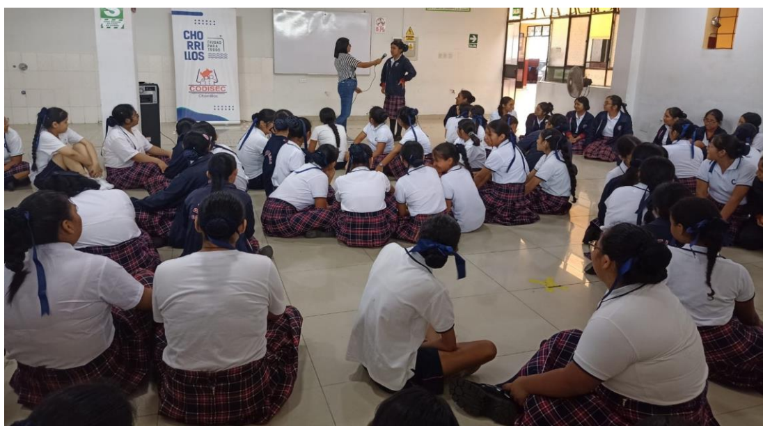
Foredrag for elevene på kvinnedagen

Bergen, 6. januar 2024 Styret i U-landsforeningen Svalene