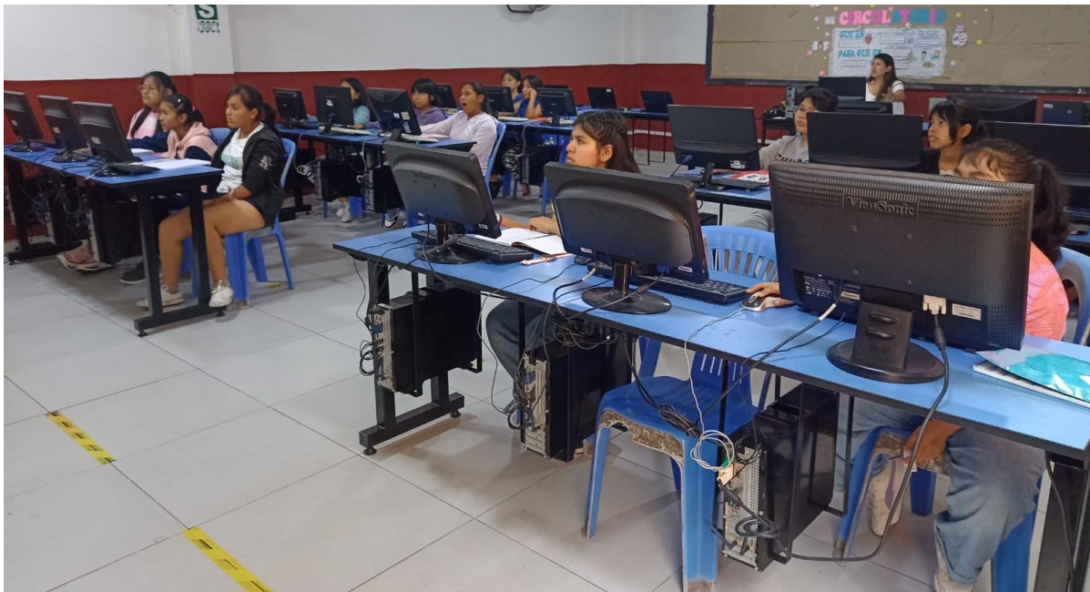
Elever med søsken og foreldre i det nye datarommet

Blant annet har de fått et større og lysere datarom i 1. etasje, med lettere tilgjengelighet for alle.