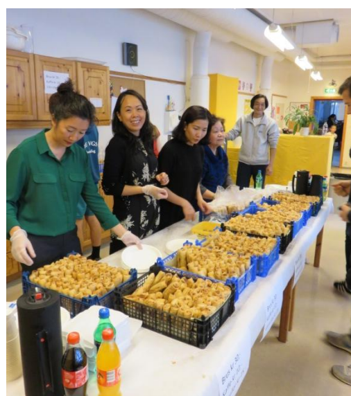
Det var ikke få vårruller de vietnamesiske foreldrene solgte...