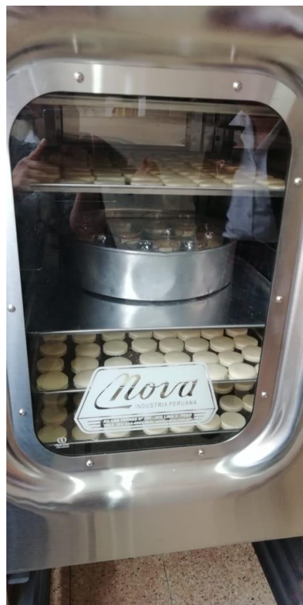
En av elevene tar i bruk den nye bakerovnen!