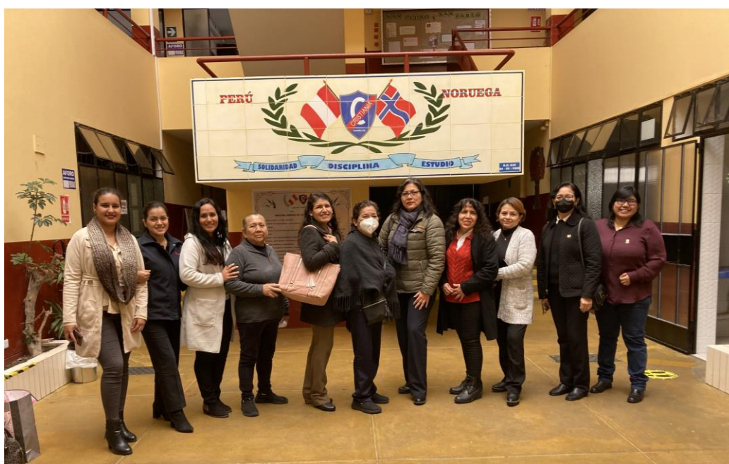
Hele laget av ansatte ved Cristiania

Rektor er nøye med hvem hun ansetter. De må passe inn i teamet. Det fungerer pr. i dag veldig bra, og alle de ansatte støtter og hjelper hverandre.