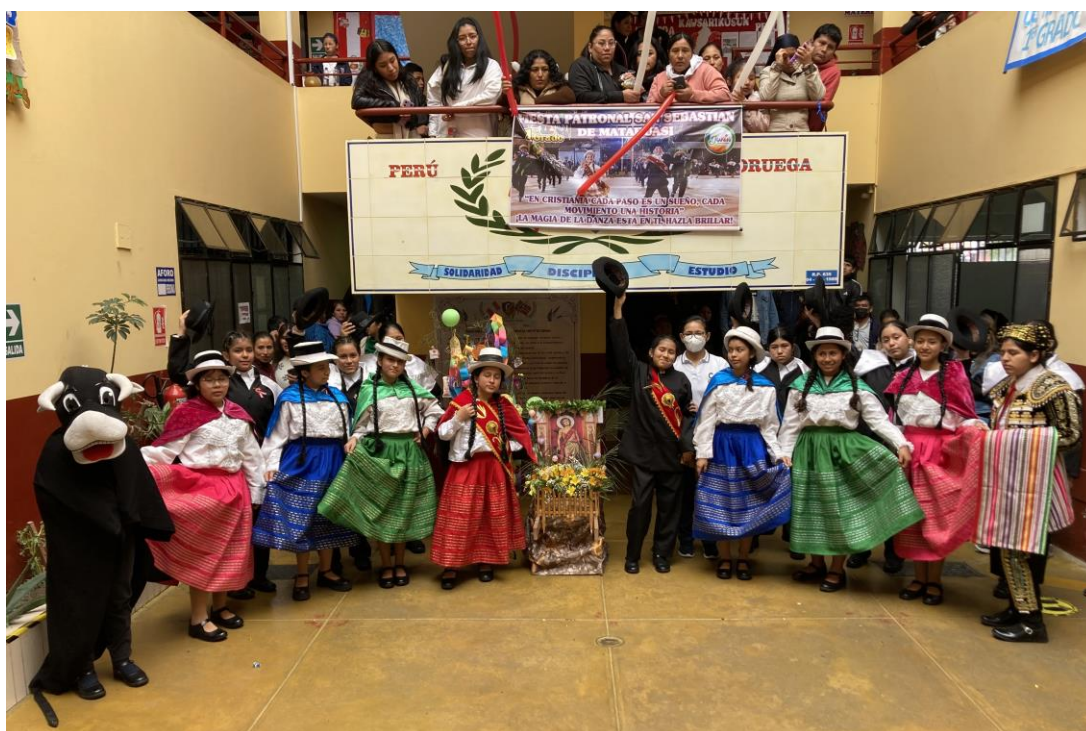
Elevene lærer ulike folkedanser, her med lånte drakter i anledning nasjonaldagen

Skolen har fått mange krav fra Undervisningsministeriet som de må etterkomme. Dette krever en god del ekstra finansiering. Dessverre har man blitt nødt til å gjøre beinharde prioriteringer, og det har gått utover muligheten til å gi mat til jentene. Heldigvis har skolen klart å forlenge tidsfristene for flere av utbedringene, og dette innebærer at vi kan fordele utgiftene over flere år framover.