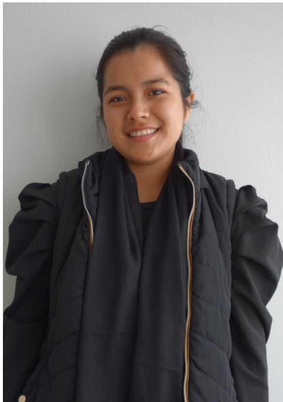
Psykologen på Cristiania